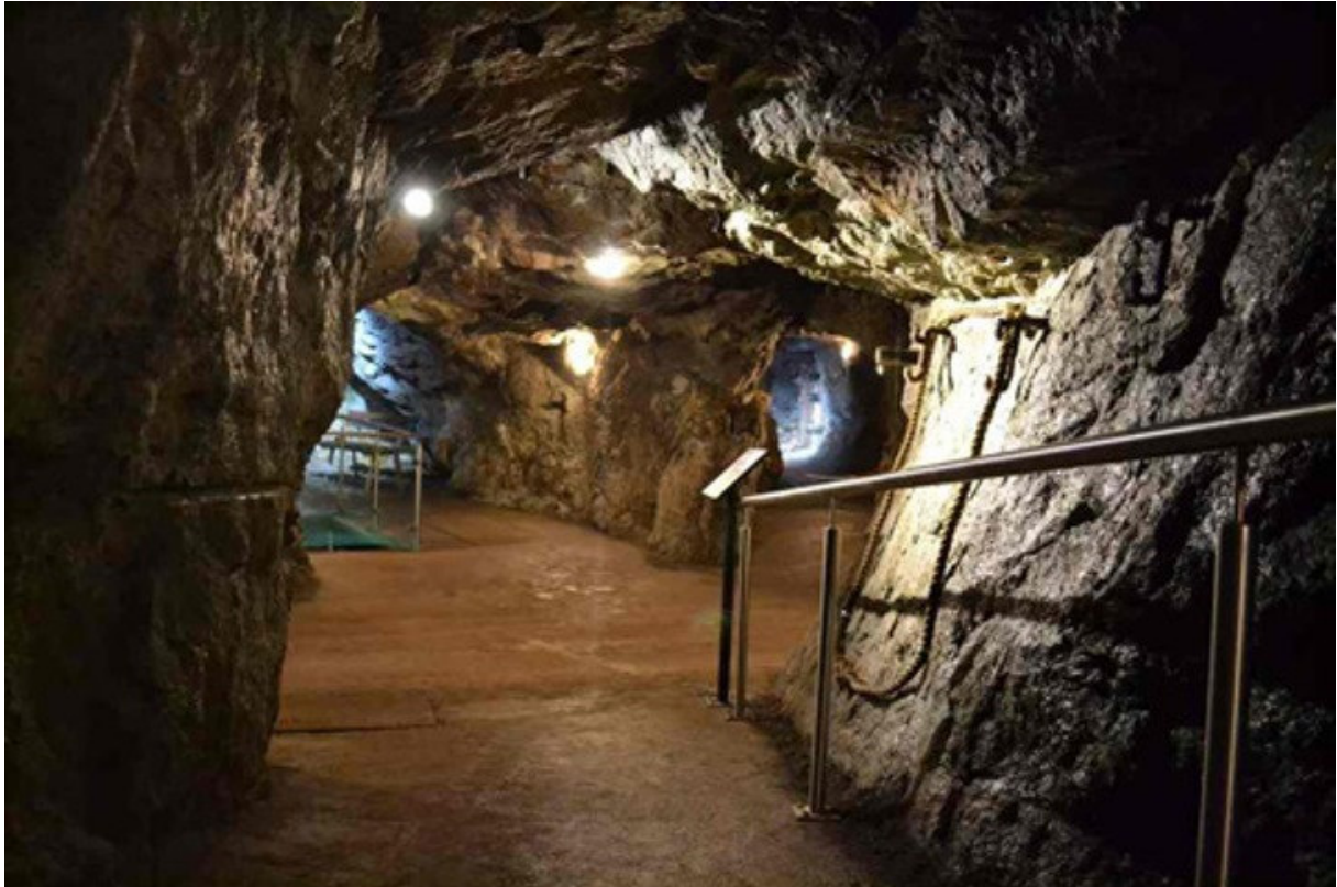
Kreuzungsbereich im Erbstollen