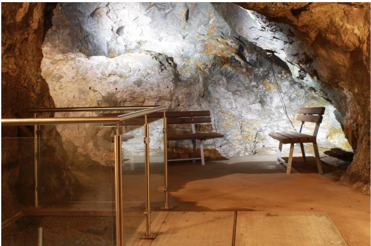
Ruhebänke und Wasserstollen