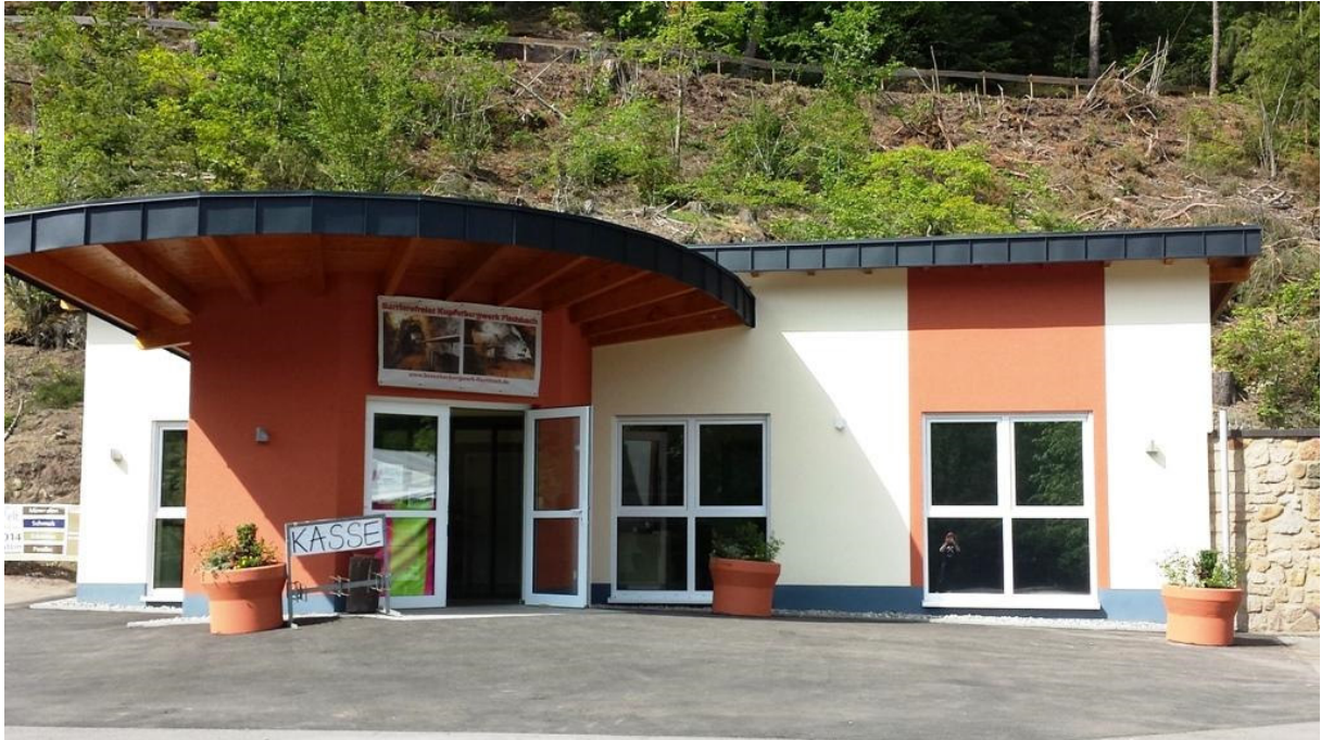
Empfangsgebäude incl. barrierefreier Toiletten