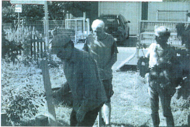
Bau und Aufbau der Schautafeln